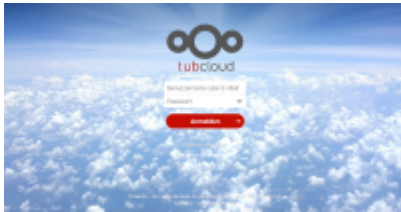
tubCloud mit Collabora-Office-Integration