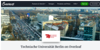
Overleaf-Portal der TU Berlin