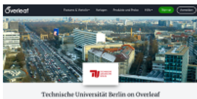
Overleaf-Portal der TU Berlin