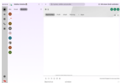
Download der Webex-Teams-Applikation