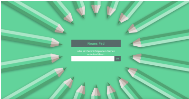
Etherpad von innoCampus