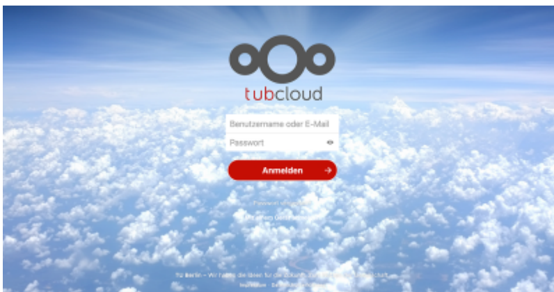
tubCloud mit Collabora-Office-Integration