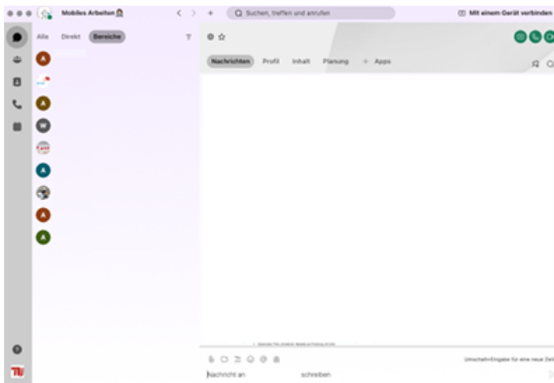
Download der Webex-Teams-Applikation