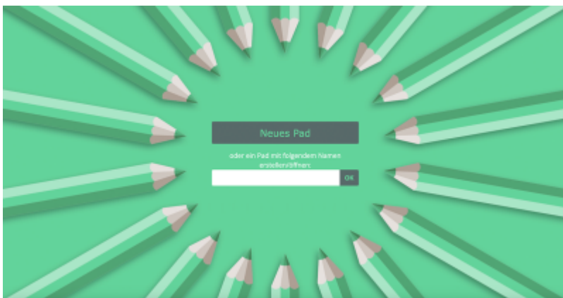
Etherpad von innoCampus